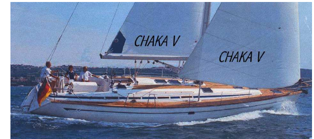
Segelschulschiff CHAKA V ...natürlich mit gesetzlicher SeeBG-Abnahme

TÖRNTERMINE 2017 Segel- und Motorboottörns