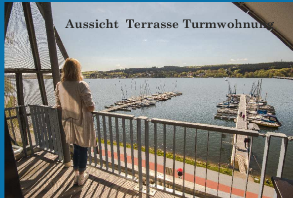
Aussicht Terrasse Turmwohnung

ADAC-Yachtschule Mönesee und Cafe / Restaurant „LÄNGSSEITS“ Udo Rahmann Brückenstr. 27-29 59519 Mönesee-Körbecke