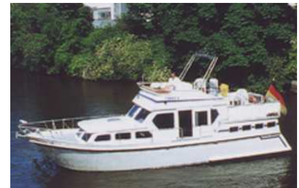
Motorschul- und Charterschiff CHAKA IV