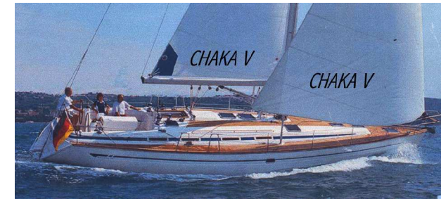
Segelschulschiff CHAKA V ...natürlich mit gesetzlicher SeeBG-Abnahme

TÖRNTERMINE 2019 Segel- und Motorboottörns